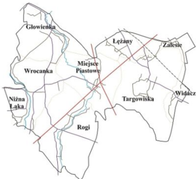
Widok na Miejsce Piastowe z lotu ptaka.